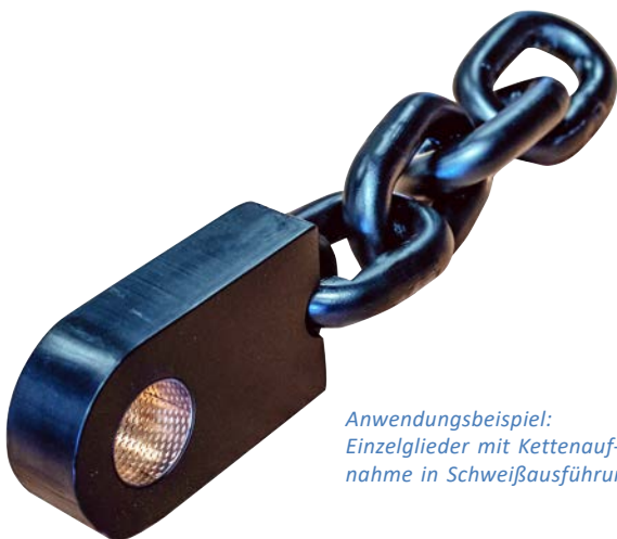
Anwendungsbeispiel: Einzelglieder mit Kettenaufnahme in Schweißausführung.

Entsprechend bieten THIELE-Recycling-Systeme einen wirtschaftlichen Entsorgungsprozess.