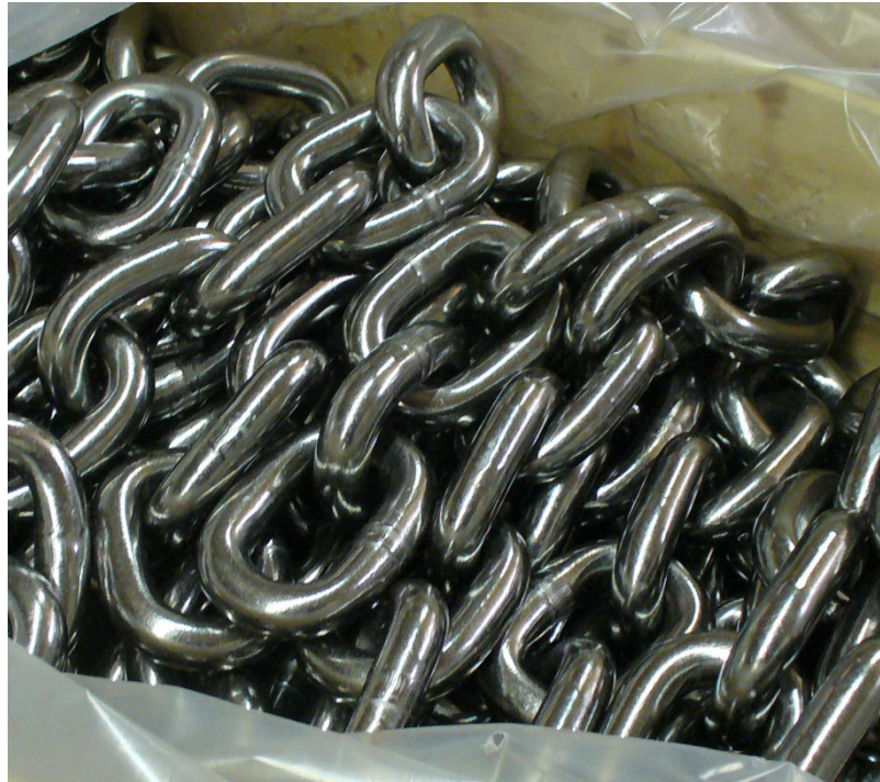
Durch eine spezielle Wärmebehandlung sind THIELE Recycling-Lösungen besonders widerstandsfähig.