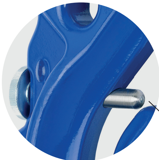
Locking pin acc. to DIN 5692